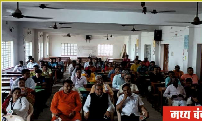
मध्य बंगाल प्रांत