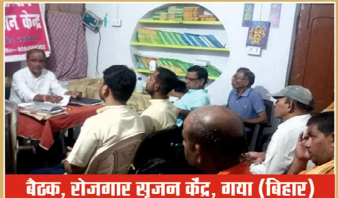
बैठक, रोजगार सृजन केंद्र, गया (बिहार)