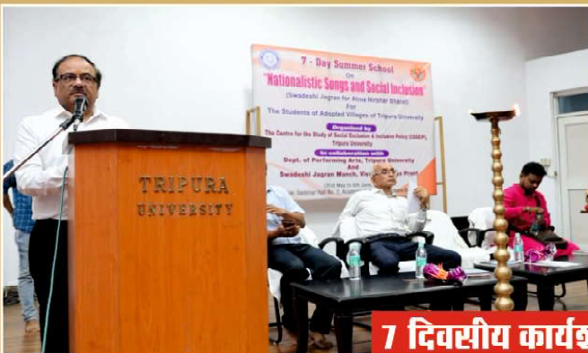
7 दिवसीय कार्यशाला - त्रिपुरा प्रांत